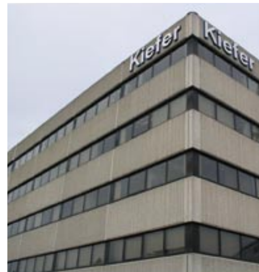
Das Gebäude der Gg. Kiefer GmbH.