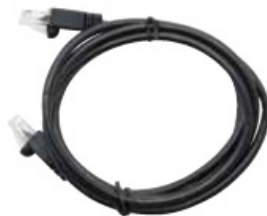
Cable de datos