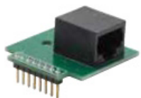
Conector de interfaz

El kit de montaje alto-bajo consiste en una carcasa de protección para el montaje remoto de un módulo sensor, un conector de interfaz que se enchufa en un detector de gas existente, y un cable de datos enchufable de 2 metros (7 pies) (tipo RJ45) que interconecta los dos.