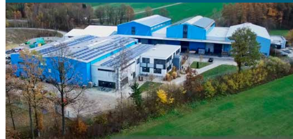
Die Hagl GmbH nutzt alternative Energien, um das Raumklima für die Mitarbeiter in den Produktionshallen zu verbessern.

Heizen durch Blechumformung – Energieventile unterstützen Wärmerückgewinnung