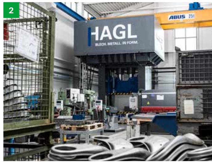
Pressen für die Blech- und Metallverarbeitung