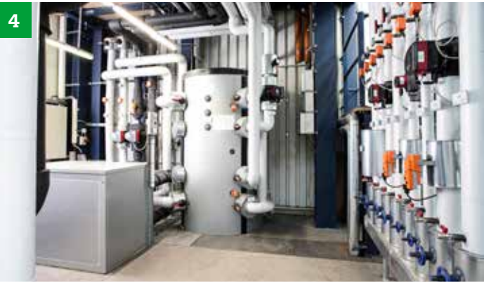
Heizkreisverteiler mit Pufferspeicher