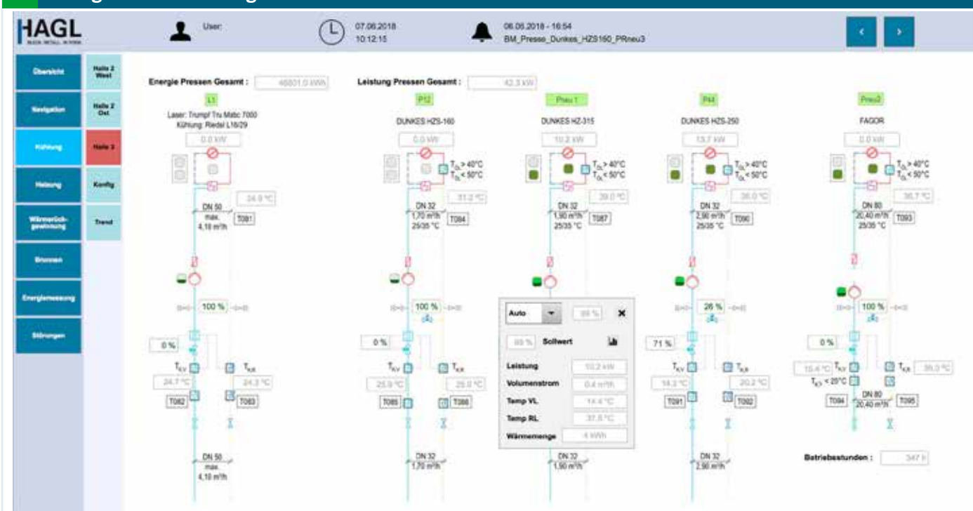
Pressen in Halle 3 mit Live-Daten – alle Messdaten des Belimo-Energieventils