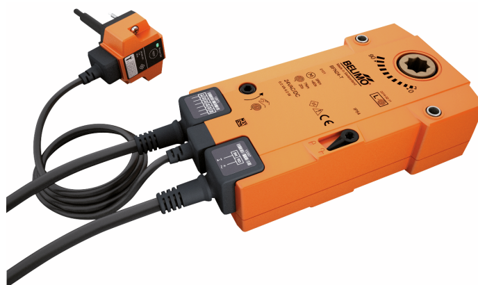
La figura puede diferir del producto