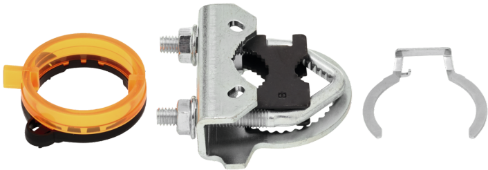
La figura puede diferir del producto