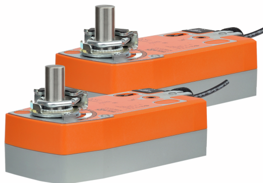
La imagen puede diferir del producto