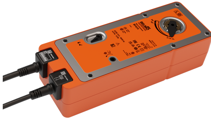
Kuva voi poiketa tuotteesta