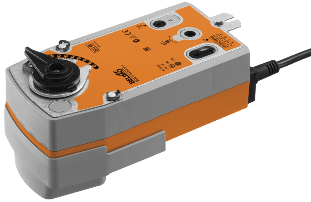
Kuva voi poiketa tuotteesta