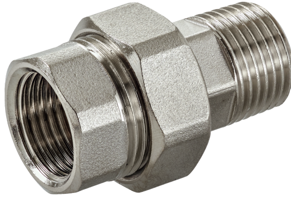
Kuva voi poiketa tuotteesta