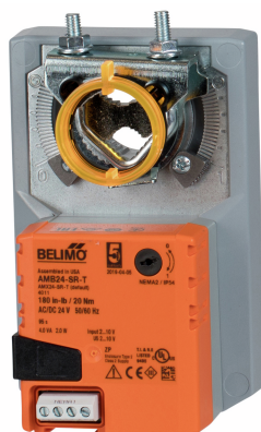
L'image peut différer du produit