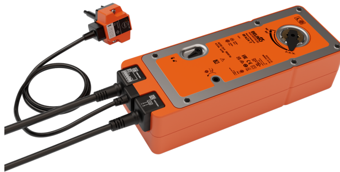
A kép eltérhet a terméktől