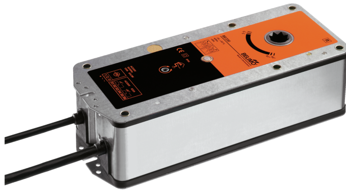
Bildet kan avvike fra produktet