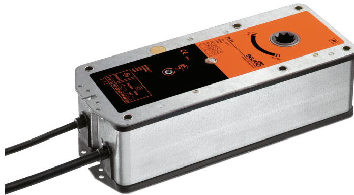
Bildet kan avvike fra produktet