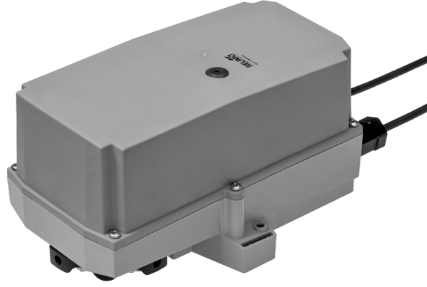
Resim üründen farklı olabilir