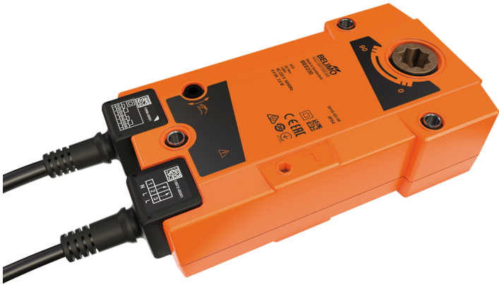
图片可能与实际产品不同