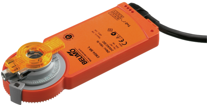
图片可能与实际产品不同