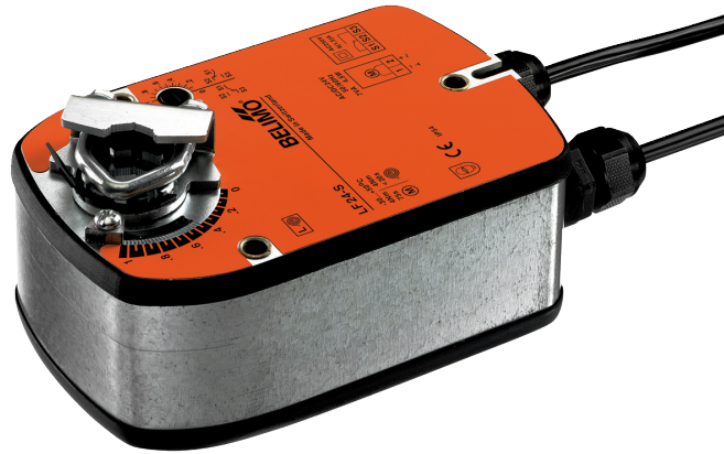
图片可能与实际产品不同