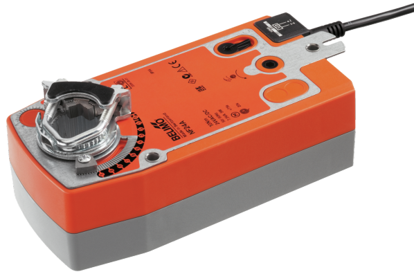
图片可能与实际产品不同