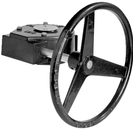
图片可能与实际产品不同